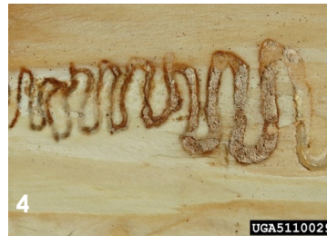
Galerie en « S »