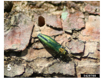
Trou en forme de « D »