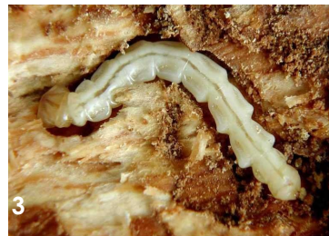
Larve : 2,6 et 3,2 cm