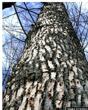
Activité des pics